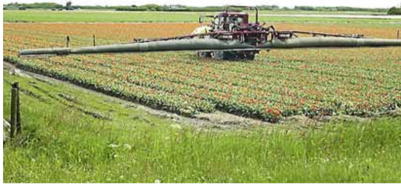
Spuiten in de bollen. Dat kan veel minder, volgens kwekers.

Gangbaar versus biologisch in de bollen- en groenteteelt is nu zwart tegen wit, stelt Warmerdam. „We moeten beide toe naar grijs. Dat is een kwestie van jaren. Alleen op deze wijze heeft ons vak ook op de lange duur toekomst.”